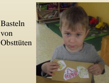
Basteln von Obsttütten