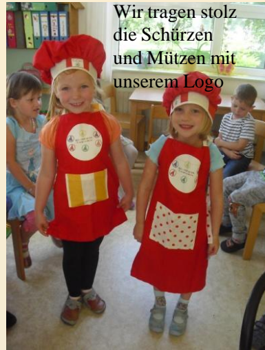
Wir tragen stolz die Schürzen und Mützen mit unserem Logo