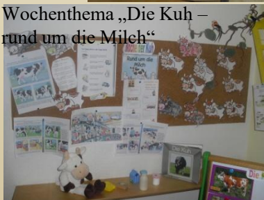
Wochenthema „Die Kuh - rund um die Milch“