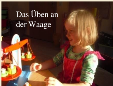
Das Üben an der Waage