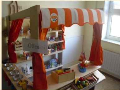
Aus Knete selbst hergestellte Produkte