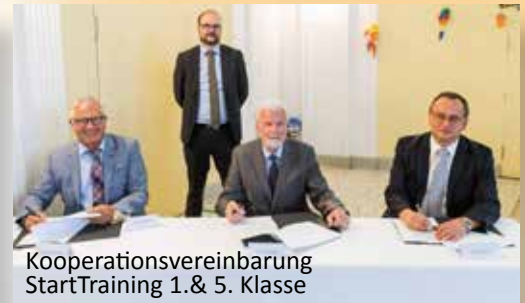
Kooperationsvereinbarung StartTraining 1.& 5. Klasse