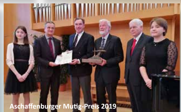
Aschaffener Mutig-Preis 2019

WAS WIR TUN Wir kümmern uns auf vielfältige Weise und auf unterschiedlichen Ebenen um die Verbesserungen der Fähigkeiten und Fertigkeiten von Kindern, Jugendlichen und jungen Menschen insbesondere in sogenannten sozialen Brennpunkten. Wir stoßen Projekte an und/oder führen sie durch.