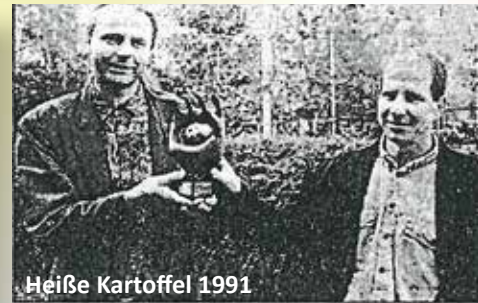
Heiße Kartoffel 1991