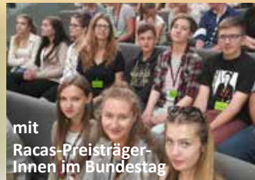
mit Racas-PreisträgerInnen im Bundestag