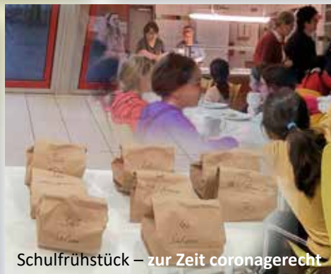
Schulfrühstück – zur Zeit coronagerecht