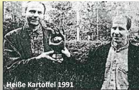
Heiße Kartoffel 1991