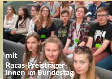
mit Racas-PreisträgerInnen im Bundestag