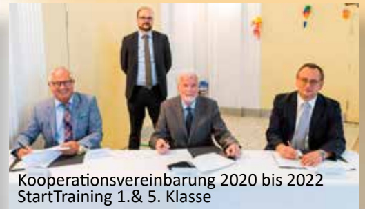
Kooperationsvereinbarung 2020 bis 2022 StartTraining 1.& 5. Klasse