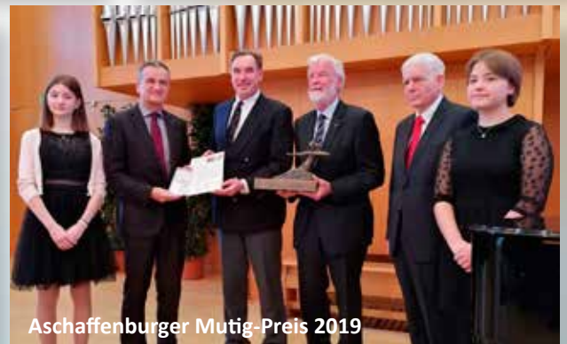
Aschaffener Mutig-Preis 2019

WAS WIR TUN Wir kümmern uns auf vielfältige Weise und auf unterschiedlichen Ebenen um die Verbesserungen der Fähigkeiten und Fertigkeiten von Kindern, Jugendlichen und jungen Menschen insbesondere in sogenannten sozialen Brennpunkten. Wir stoßen Projekte an und/oder führen sie durch.