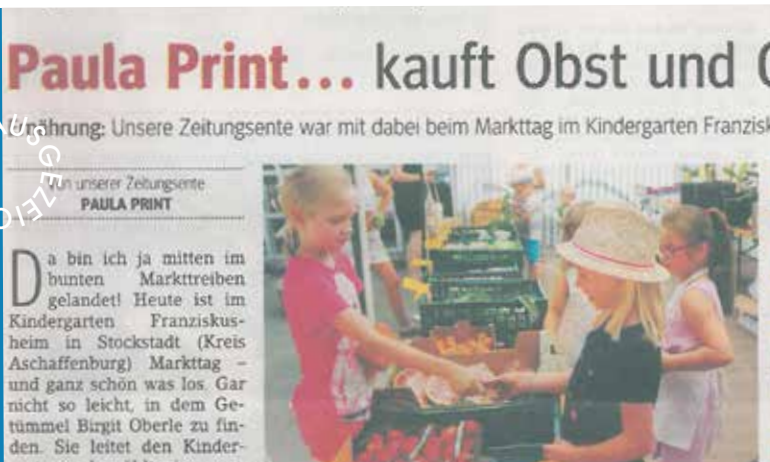
Markttag im Kindergarten Franziskusheim Stockstadt am Main Foto und Artikel: Main-Echo Aschaffenburg