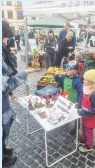
kidsMARKTSTAND in Leipzig