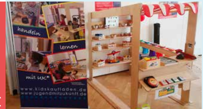
Erster sprechender kidsKAUFLADEN – auch für Kinder mit eingeschränkter oder ohne Mundsprache beim UK*-Kongress in Leipzig, *UK: unterstützte Kommunikation