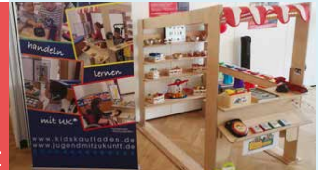
Erster sprechender kidsKAUFLADEN – auch für Kinder mit eingeschränkter oder ohne Mundsprache beim UK*-Kongress in Leipzig, *UK: unterstützte Kommunikation