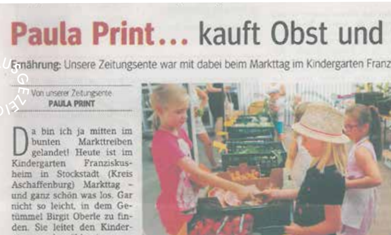
Markttag im Kindergarten Franziskusheim Stockstadt am Main Foto und Artikel: Main-Echo Aschaffenburg