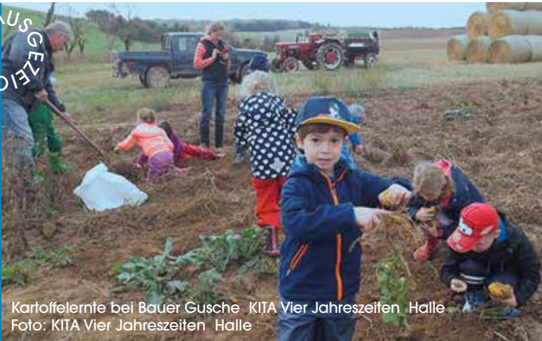
Kartoffelernte bei Bauer Gusche KITA Vier Jahreszeiten Halle