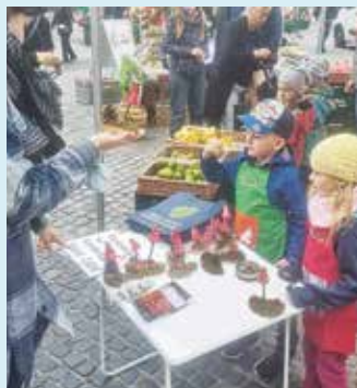
kidsMARKTSTAND in Leipzig