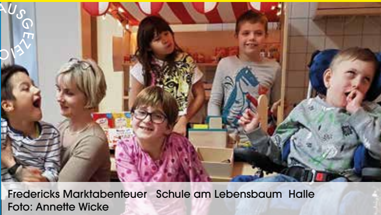
Fredericks Marktabenteuer Schule am Lebensbaum Halle