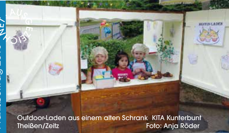
Outdoor-Laden aus einem alten Schrank KITA Kunterbunt Theißen/Zeitz